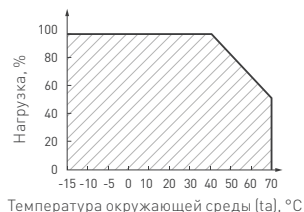
Рис. 3. Максимальная допустимая нагрузка, % от мощности источника