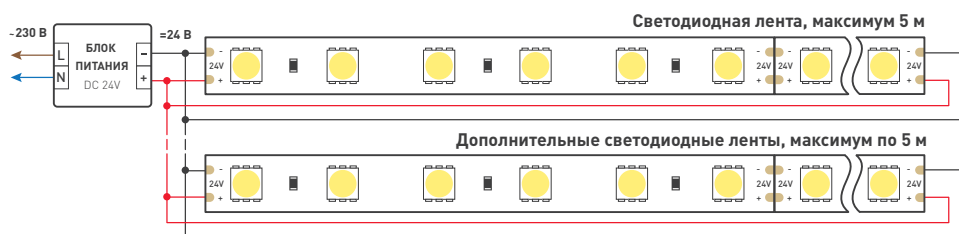
Схема 2. Подключение нескольких светодиодных лент с двух сторон. Рекомендуется использовать для обеспечения равномерного свечения ленты по всей длине