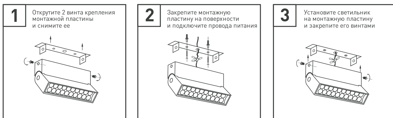
Рис. 2. Установка и подключение светильника